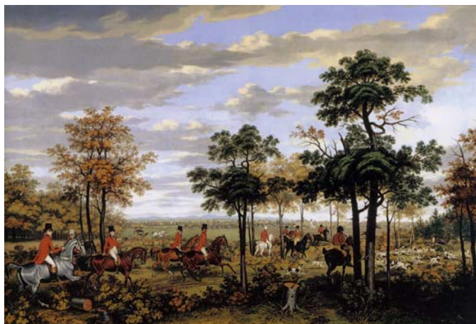
Hon na louce u Nového Dvora; sbírky NPÚ